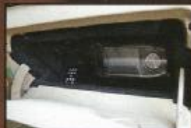
Mobile Alpine-Navi "Blackbird" mit Dockingstation