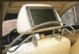
Kino auf den hinteren Plätzen