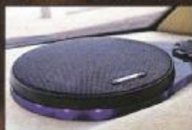
Carpower "Neoset-165" als Rearfill-Lautsprecher