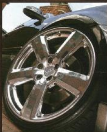
Auf Hochglanz: original Audi-RS6-Felgen

präsentiert wurde. Und der Sound? Davon konnten wir uns beim Foto-termin mit ihm überzeugen: ohne Spektakel, aber spektakulär gut! Mit einem völlig ausgewogenen Klangbild, aber dennoch sehr dynamisch und mit feiner Detailzeichnung glänzt die Anlage genauso wie mit ihrer realistischen Bühnenabbildung. Und dass sich die acht "Raptoren" in ihren Kisten wie zuhause fühlen, merkt man am präzisen wie kernig-druckvollen Bass, der verdammt Spaß macht.