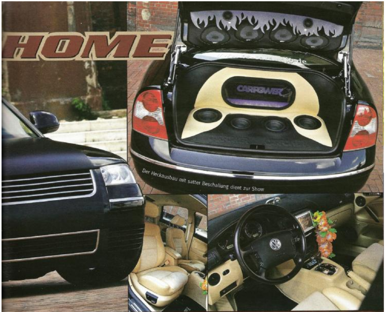
Der Heckausbau mit satter Beschallung dient zur Show