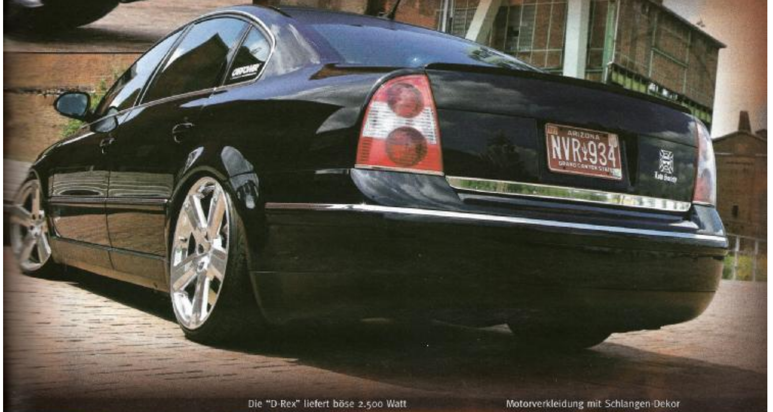
Die „D-Rex“ liefert böse 2.500 Watt

die anderen vier in einem ebenfalls ventilierten Gehäuse im Kofferraum implantiert sind. Hier ist hinter einer U-förmigen Trennwand mit Acrylfenster ein „D-Rex/2500“-Monoblock verbaut, der die acht „Raptoren“ mit satten 2,5 kW Leistung vorwärtstreibt. Hinter der Rücksitzbank ist neben einem Alpine-