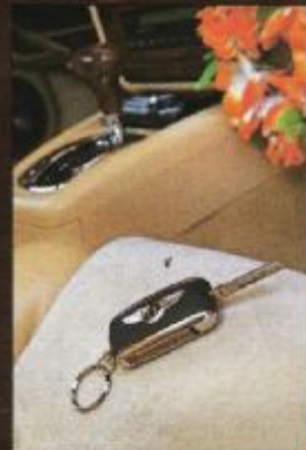
Christians Traumauto: aus England mit dem "B" auf der Haube