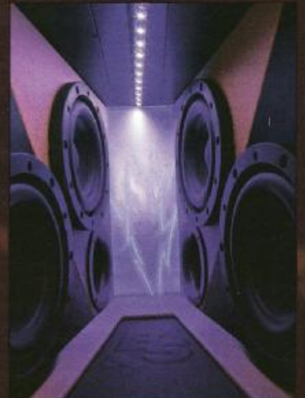
Vier "Raptoren" lauern in der Skisacköffnung Die Hochtöner sind auf die Hörposition ausgerichtet

Hoch eingebauter Mitteltöner für perfekte Büh-nenabbildung