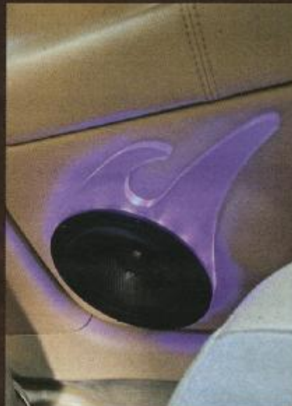
Kickbass mit mattiertem Acryl und blauen LEDs "Raptor"-Viererbande

stabilen Unterbau aus MDF-Ringen. Hierbei kombinierte man die vorderen zwei mit je einem Mitteltöner "MS-100CHQ" und einer Hochtonkalotte "DT-284" zu Dreiwege-Systemen. Für die Mitteltöner wurde eine GFK-Ver-schalung angefertigt, die sich neben dem Türöffner harmonisch in die Verkleidung einfügt, während die Hoch-töner in angewinkelten Minigehäusen an den A-Säulen platziert sind. Als Rearfill-System fungieren in der Hut-ablage zwei "Neoset-165", die auf ei-nem geformten Unterbau mit schwar-zer, flammenförmiger Acrylplatte und blauer LED-Beleuchtung sitzen. Ein Stilelement, das auch die Kickbässe und die Lautsprecher in der Heckklap-pe bekamen, allerdings aus farblosem Acryl mit Milchglas-Optik.