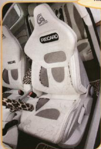
Wer hier Platz nimmt, darf sich auf ein akustisches Feuerwerk gefasst machen