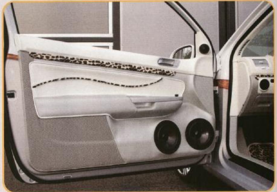
Geschlossene GFK-Kickbass-Gehäuse in den vorderen Türen bringen eine Impuls wiedergabe vom Feinsten

unzählige Möglichkeiten zur Klangoptimierung, z.B. SRS Circle Surround Automotive, parametrischen Equalizer, Laufzeitkorrektur und „Sound-Management-System“. Im nächsten Arbeitsschritt wurden die Rearspeaker in die hinteren Seitenverkleidungen eingepasst und die Viper-Alarmanlage installiert. Parallel kümmerte sich B&S-Mitarbeiter Alex Härtig um das Bassgehäuse für den Kofferraum. Neben dem Drucklufttank und den beiden Sonic-12-Subwooferchassis mussten noch zwei große Vortex 4/400-Endstufen sowie zwei Pufferelkos untergebracht werden. Die Wooferbehausung bekam eine abgerundete Unterseite bis an den Tank heran. Das Ganze wurde mit einer geschwungenen Schale aus Holz und GFK mit gezackten Ausschnitten für Caps und Firmenlogo verkleidet und edel lackiert.