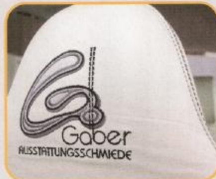
Design trifft handwerkliche Perfektion: Nähte vom Allerfeinsten