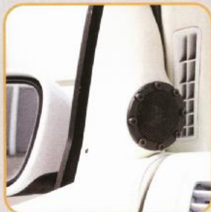
Die Hochtöner erhielten GFK-Gehäuse an den A-Säulen