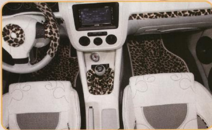
Der Kenwood Doppel-DIN-DVD-Monitor bietet hohen Bedienkomfort und eine Fülle an Einstellmöglichkeiten