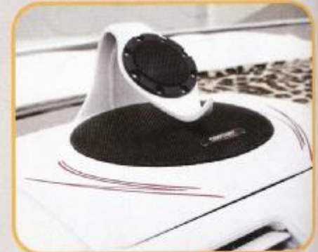
Das 13er-2-Wege-Komposystem Neoset 130 macht hier einen brillanten Centerjob