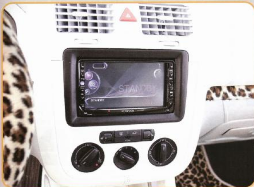
Die Headunit erhielt einen speziellen Doppel-DIN-Rahmen

besonders feine Auflösung und hohe Belastbarkeit aus (wir hörten „End of the Line“ von Randy Crawford und Joe Sample, man beachte die eingeworfenen Pianopassagen). Stimmen, z.B. die von Armand Amar, kommen so anrührend wie im Konzertsaal und werden satt und in ihrer ganzen Fülle wiedergegeben (und das ist bei dieser Ausnahmestimme wirklich eine Leistung!).