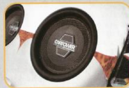
Die Sonic-12 30er-Woofers von Carpower garantieren Bass vom Allerfeinsten