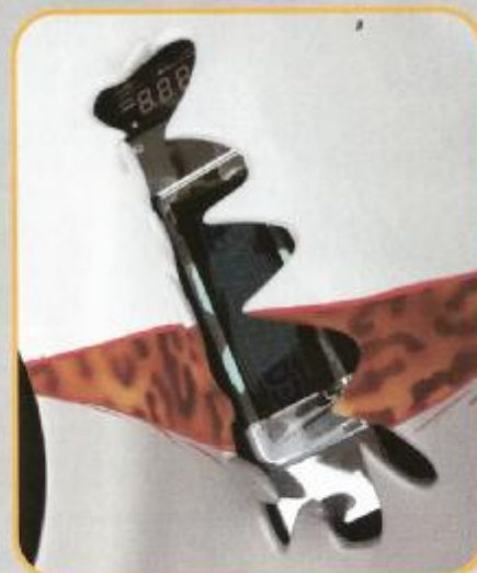
Zwei Caps sorgen dafür, dass der Anlage nicht die Puste ausgeht