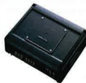
Amplificadores KAC-X1D y KAC-X4D